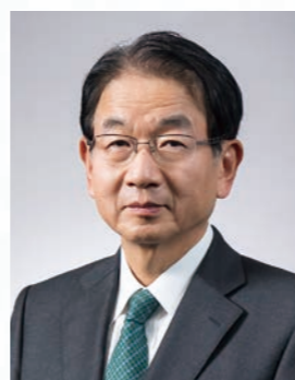
Representative Director, Chairman, President & CEO

Socionext汇聚了来自消费者、汽车和产业领域的业绩卓著的研发力量，旨在“创造新价值为社会做贡献”。为了实现能够让未来社会和人类生活更加便利、快乐和丰富的“Better Quality of Experience (最佳品质体验)”，我们以多年积累的技术为基础，面向全世界提供新商品、新价值和服务。超越以往的事业范围，勇于挑战，力争创造出客户真正追求的价值，请拭目以待。