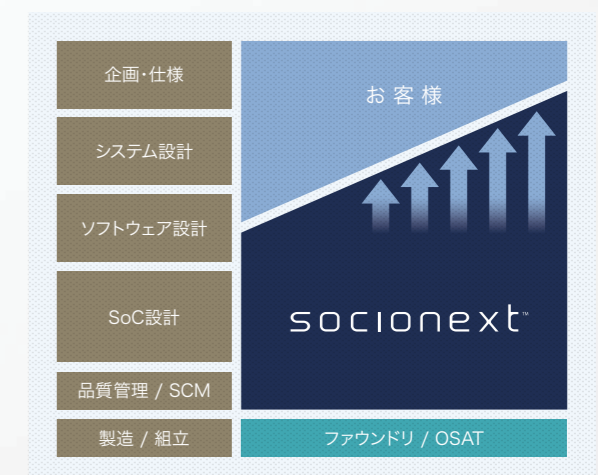
ソシオネクストの“Solution SoC”

こうしたお客様ニーズや市場環境の変化に応えるため、ソシオネクストは、お客様のコンセプト段階から関与し、エコシステムの最適な組み合わせを提案することで、差別化SoCを実現する“Solution SoC”カンパニーを目指します。それは、論理合成や物理設計に注力する従来型ASICとは付加価値を異にするソシオネクストならではのユニークなビジネスモデルです。