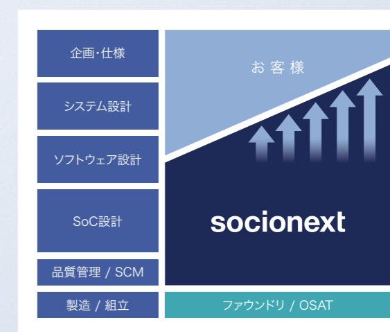
ソシオネクストの“Solution SoC”

こうしたお客様ニーズや市場環境の変化に応えるため、ソシオネクストは、お客様のコンセプト段階から関与し、エコシステムの最適な組み合わせを提案することで、差別化SoCを実現する“Solution SoC”カンパニーを目指します。それは、論理合成や物理設計に注力する従来型ASICとは付加価値を異にするソシオネクストならではのユニークなビジネスモデルです。